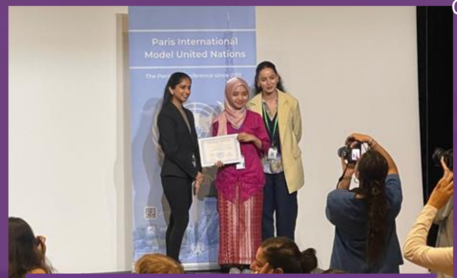
Mahasiswa FKM UI Menjadi Delegasi Paris International Model United Nations (PIMUN) 2024