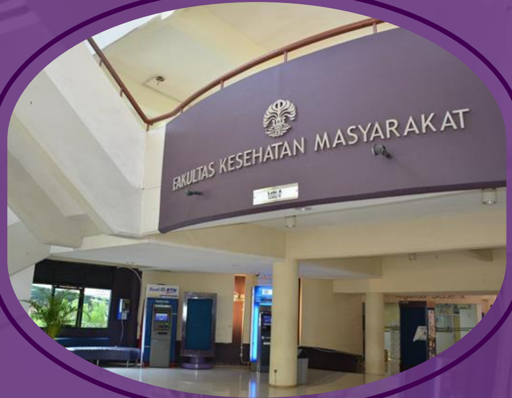
Lobby Gedung A