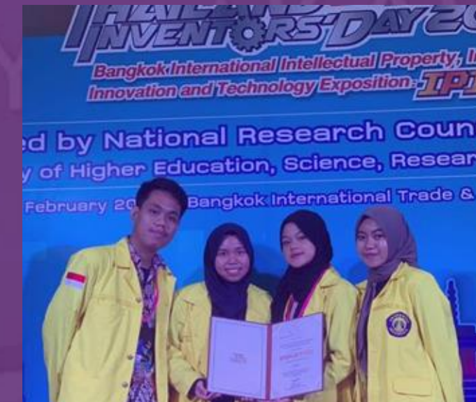
Medali Perunggu dalam kategori Class G: Robotics/Electronics/Automation/IoT and Application/Information, Communication and Technology (ICT) di Thailand Inventors' Day