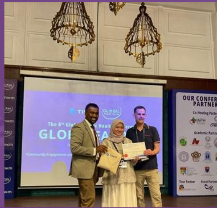
Best Social Media Ambassador The 8th Global Public Health Conference (GlobeHeal 2025), Thailand