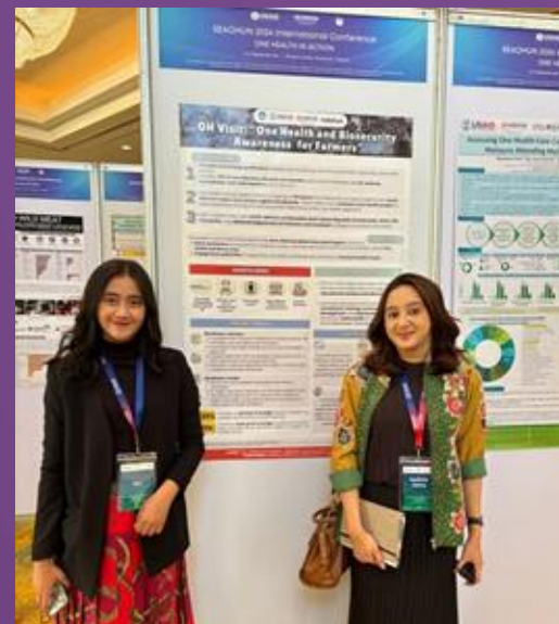
Poster presenter pada The Southeast Asia One Health University Network (SEAOHUN) 2024 International Conference di Thailand