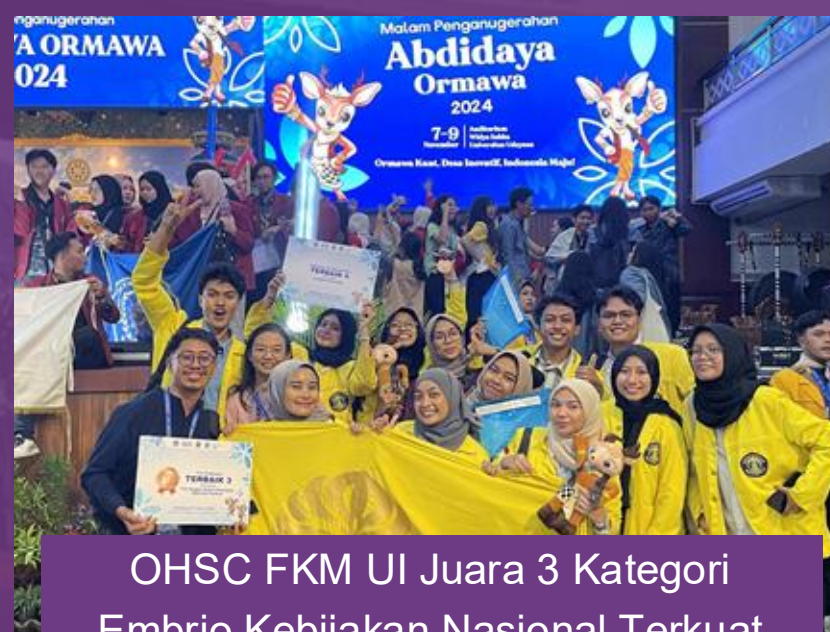
OHSC FKM UI Juara 3 Kategori Embrio Kebijakan Nasional Terkuat dan Juara 4 Kategori Ormawa Terinovatif pada Kegiatan Abdidaya di Bali