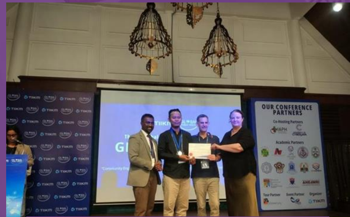
Best Presenter The 8th Global Public Health Conference (GlobeHeal 2025), Thailand