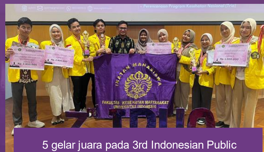
5 gelar juara pada 3rd Indonesian Public Health Olympiad 2024 di Samarinda