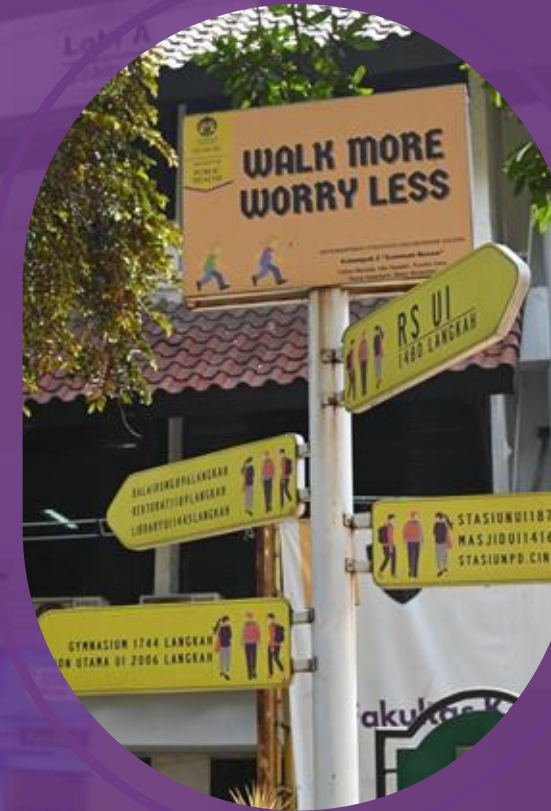
Signage anjuran jalan kaki