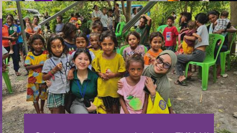
Student exchange mahasiswa FKM UI ke UNPAZ, Timor Leste