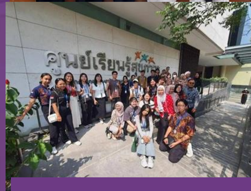
Student Exchange Mahasiswa FKM UI ke Mahidol University Thailand