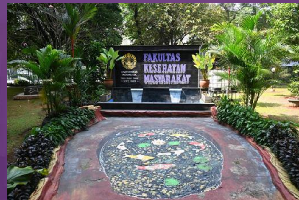
Taman FKM UI