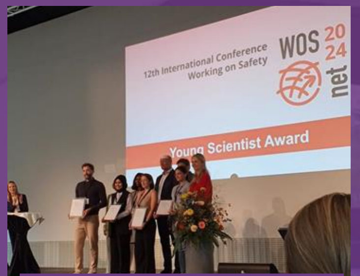
Juara 1 Young Scientist Award pada The 12th International Conference Working on Safety 2024 di Jerman