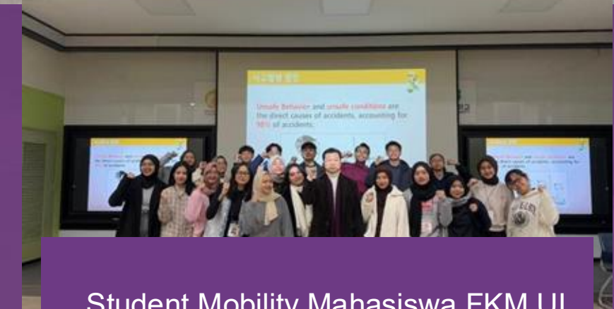
Student Mobility Mahasiswa FKM UI ke Inje University, Korea Selatan