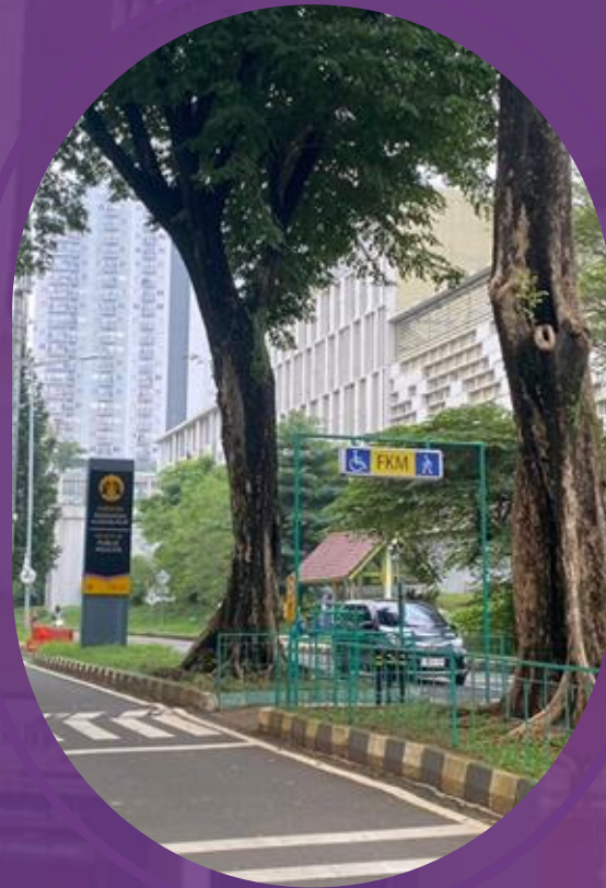
Signage FKM UI