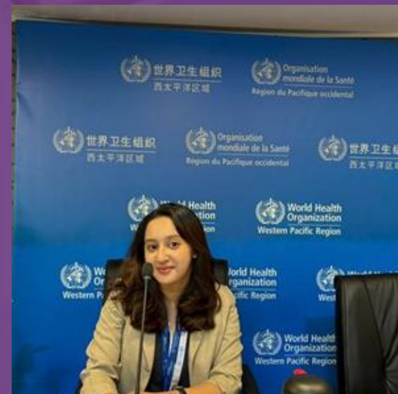
Peserta ASCEND Leadership Program yang diselenggarakan oleh Johns Hopkins University (JHU) Bloomberg School of Public Health