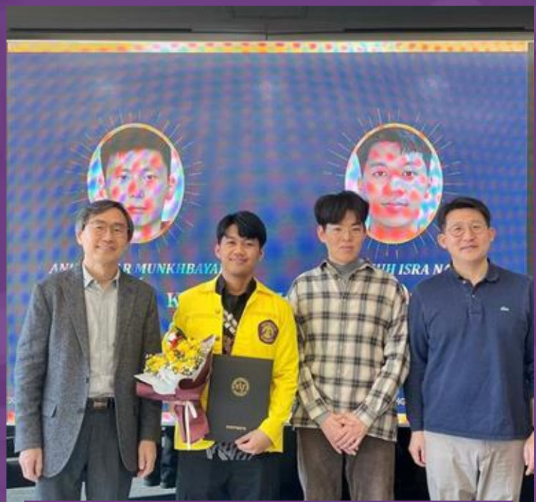
Berhasil Internship di Korea Institute of Science and Technology (KIST)