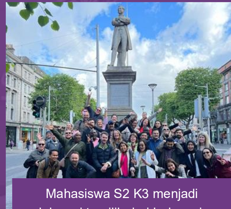
Mahasiswa S2 K3 menjadi delegasi terpilih dari Indonesia dalam Emerging Leaders Institute (ELI) di Dublin, Irlandia