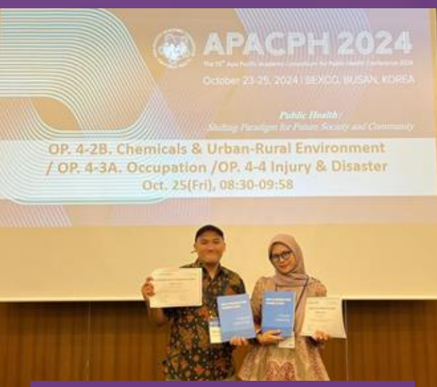
Best Oral Presentation pada The 55th APACPH 2024 di Seoul