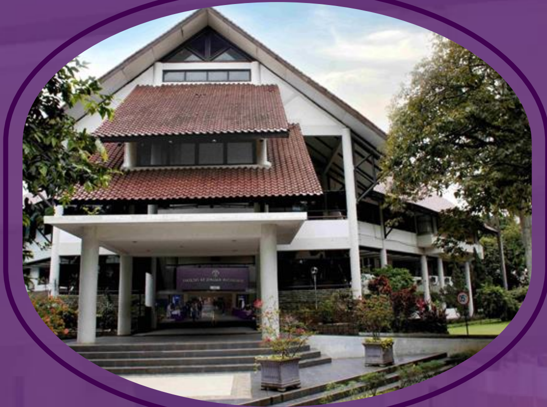
Gedung A FKM UI