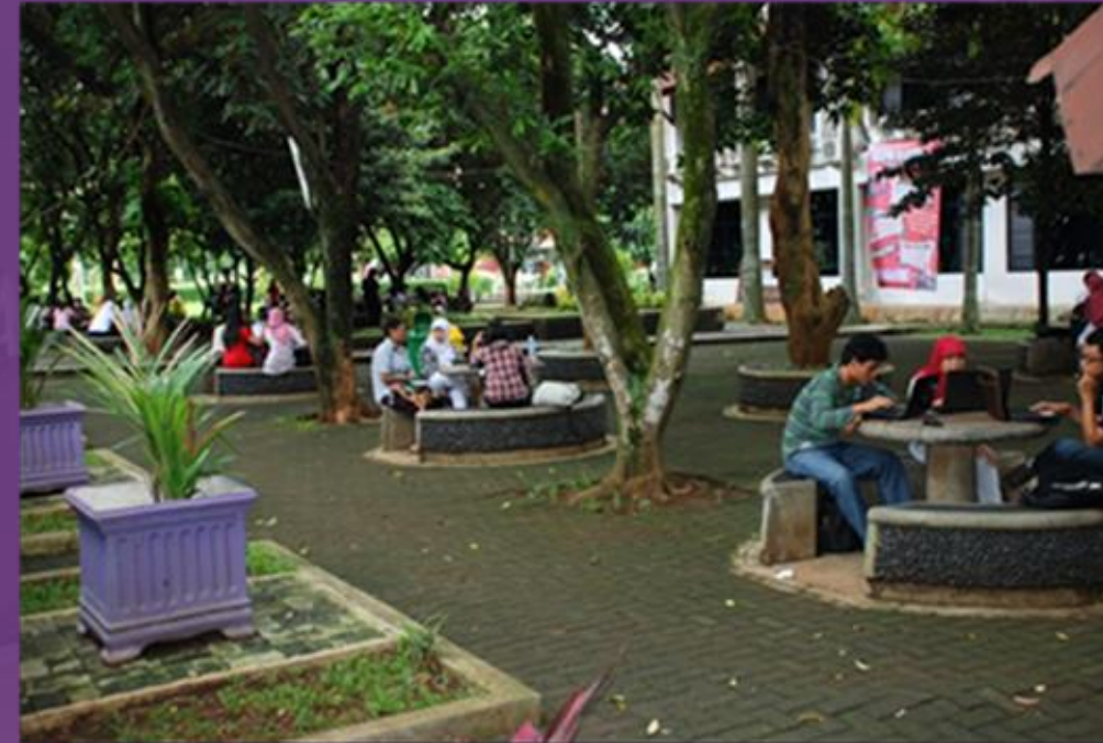
Taman Mangga (BPM)