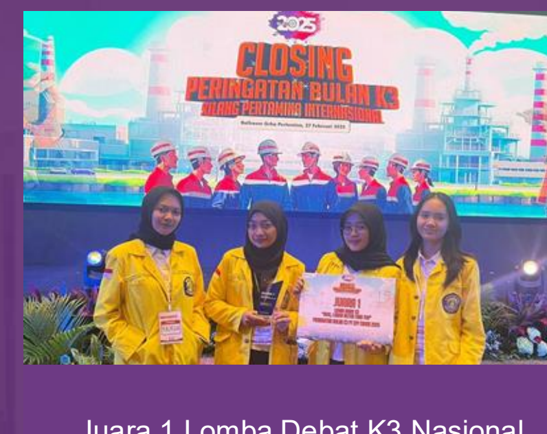
Juara 1 Lomba Debat K3 Nasional