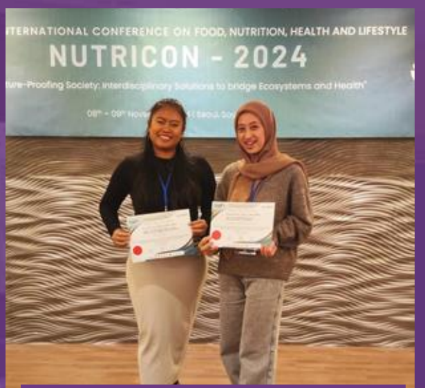
Penghargaan Best Presenter dalam NUTRICON 2024 di Seoul