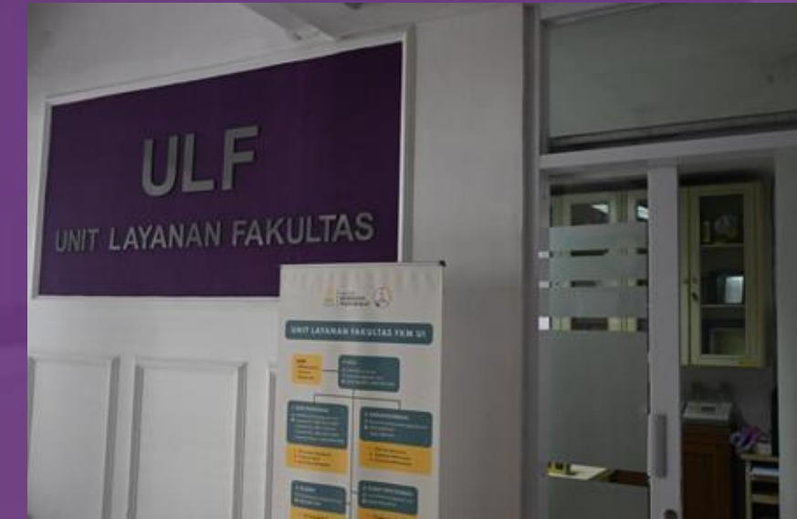
Unit Layanan Fakultas